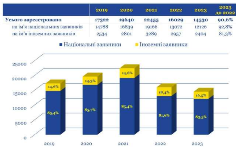
Рис. 1. За джерелом [47; 48, с. 34-35]

Серед іноземних заявників головними конкурентами у сфері подання заявок на торговельні марки є США і Кіпр. Значна кількість заявок була подана заявниками зі Швейцарії, Великої Британії, Китаю та Німеччини [47; 49, с. 12].