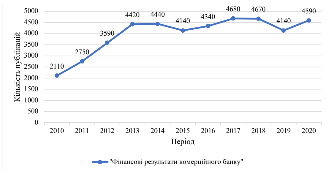
Рис. 1. Кількість опублікованих праць з ключовим словосполученням «фінансові результати комерційного банку» за останні 10 р.

питання на «GoogleАкадемія» (рис. 1) за період з 2010 р. по 2020 р. постійно зростає (з 2110 шт. у 2010 р. до 4590 штук у 2020 р.).