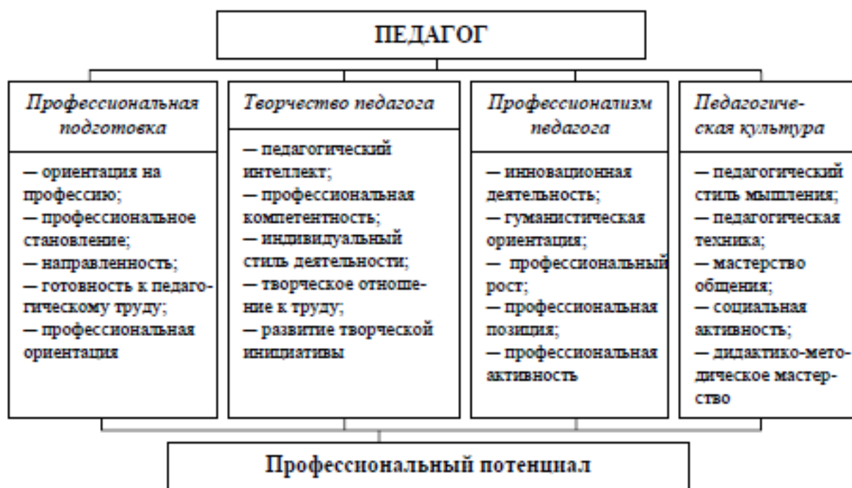
Рис. 1. Ключевые критерии определения профессиональной компетентности педагога в современной сфере образования

Педагогические условия – это значимые обстоятельства, определяющие достижение высокого уровня формирования профессиональной компетентности преподавателя. Педагогическими условиями, способствующими эффективности формирования профессиональной компетентности педагога в образовательном процессе вуза, являются [3]: