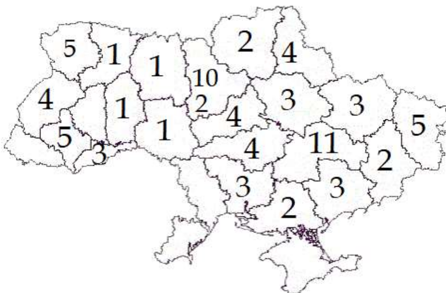
Рис. 1. Географія заявок, поданих на конкурс за 2017 рік

Серед усіх впроваджених практик визначено 10 практик-переможців, які представляли Дніпропетровську область (3 проєкти), Черкаську область (1 проєкт), Волинську область (2 проєкти), Івано-Франківську область (2 проєкти), Луганську область (1 проєкт) та Київську область (1 проєкт) (табл.1).