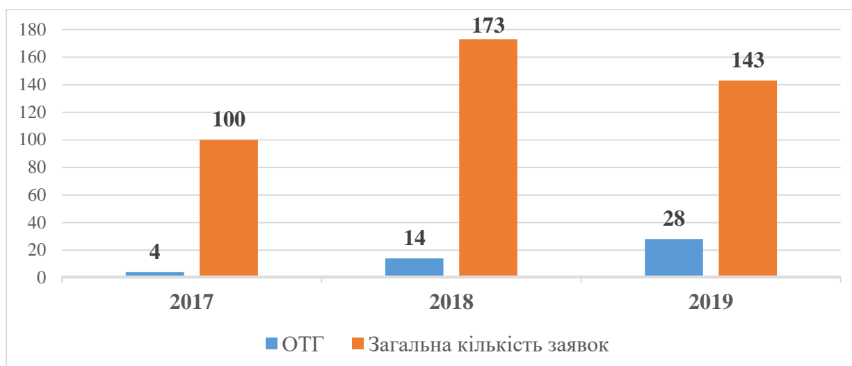
Рис. 5. Кількість заявок, поданих на Конкурс у 2017, 2018 та 2019 роках

Аналіз кількості молодіжних проєктів, поданих на конкурси у різні роки, показав, що порівняно з 2017 роком кількість заявок у 2018 збільшилася на 73% (рис. 5). Проте кількість заявок поданих у 2019 році є на 30% меншим в порівнянні з 2018 роком. Це пов'язано зі спадом активності, яка зумовлена економічною ситуацією в країні та обмеженістю фінансування молодіжної сфери.