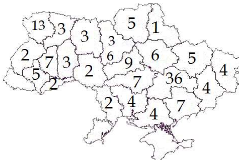
Рис. 3. Географія заявок, поданих на конкурс у 2019 році

Молодіжні проекти надійшли з міст обласного значення – 56 заявок, (39 % від загальної кількості), з міст – 58 заявок (41%), селищ міського типу – 12 заявок (8%), сіл – 17 заявок (12%).