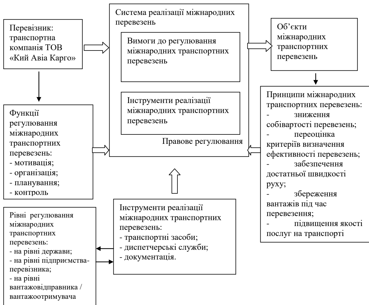
Рис. 3. Організаційна схема механізму організації міжнародних експедиторських операцій на підприємстві ТОВ «Кий Авіа Карго»

- безпосередньо підприємство ТОВ «Кий Авіа Карго», яке є перевізником та водночас виступає власником транспорту;