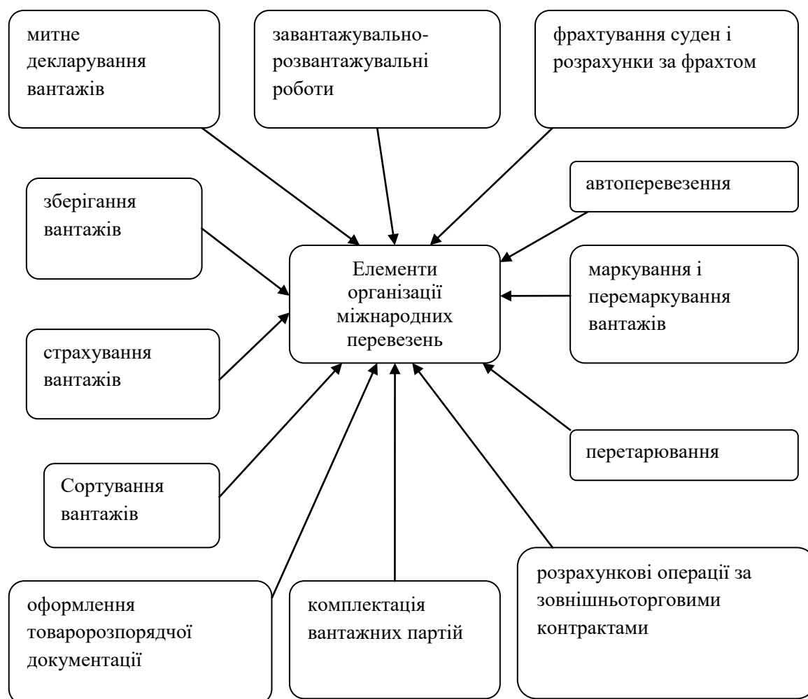
Рис. 2. Елементи організації міжнародних експедиторських операцій на підприємстві ТОВ «Кий Авіа Карго»