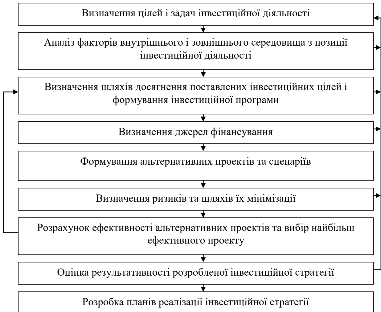
Рис. 3. Механізм інвестиційної стратегії для підприємства [8]

Останнім етапом в стратегічному інвестиційному плануванні є розробка плану реалізації стратегії (рис. 3.), при розробці інвестиційної стратегії розвитку – цей етап передбачає розробку планів реалізації інвестиційної стратегії.