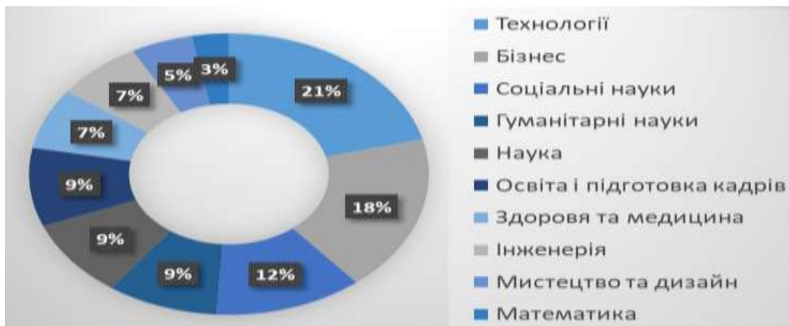
Рис. 3. Розподіл курсів на платформах MOOC за напрямками

платних онлайн-курсах. Майже три чверті дорослих людей говорять про те, що людина сама несе відповідальність за розвиток своїх талантів і навичок. Молоде покоління починає чинити опір традиційній системі навчання. Деякі навмисно уникають навчання в коледжах і вузах, вважаючи за краще онлайн-курси по важливим для них навичкам (рис.3).