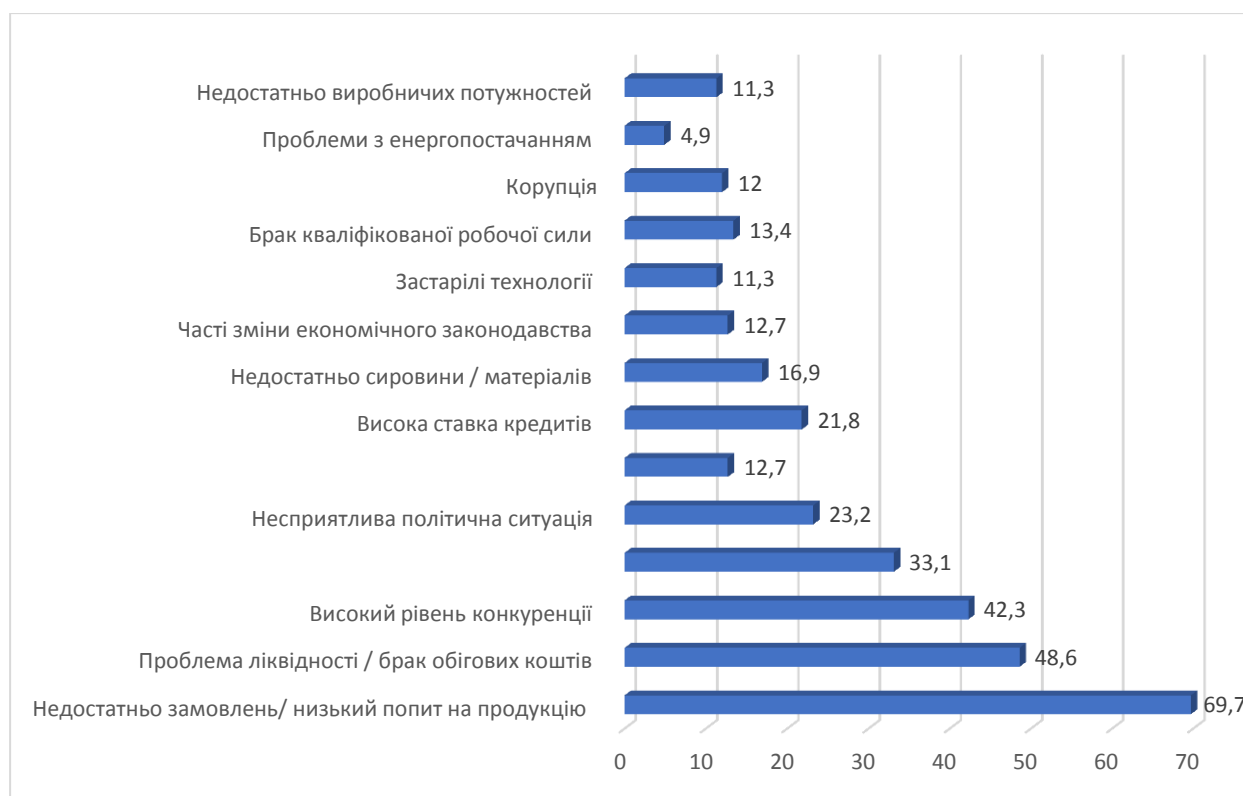
Рис. 3. Перешкоди в розвитку вітчизняних промислових малих підприємств у 2018 році

Джерело: складено автором на основі [9, с.3]