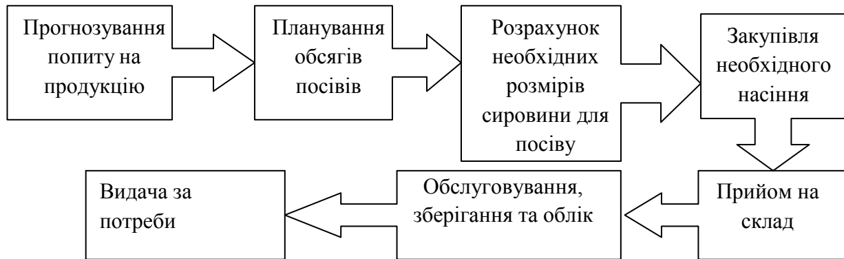
Рис. 2. Схематичне відображення послідовності дій з управління запасами в агропромисловому комплексі