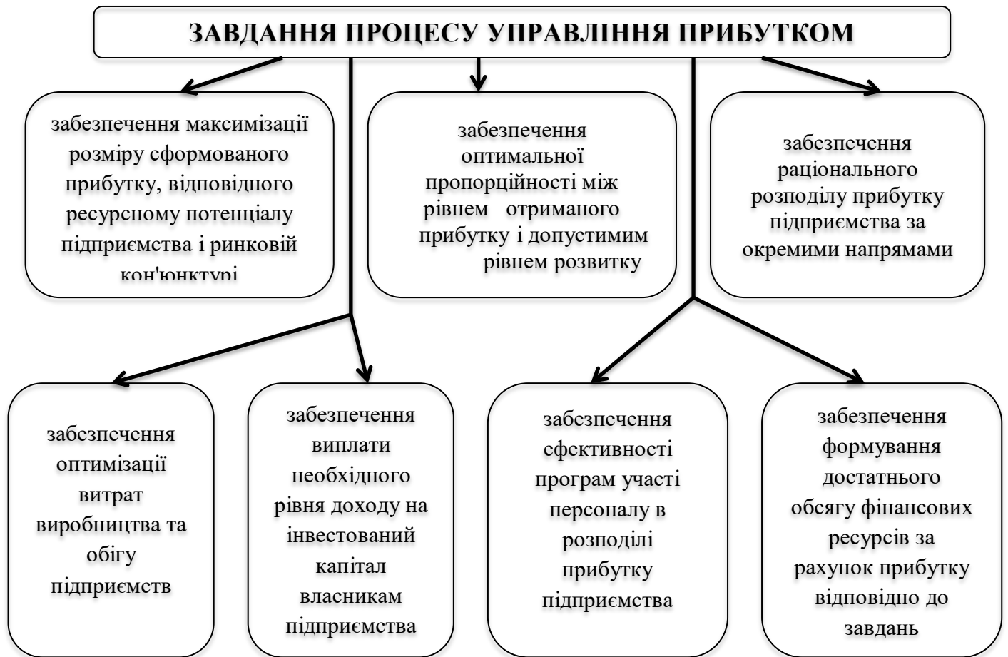
Рис. 2. Завдання процесу управління підприємства

В процесі управління прибутком суб'єкта господарювання вирішуються наступні завдання (рис.2.) [5, с. 45].