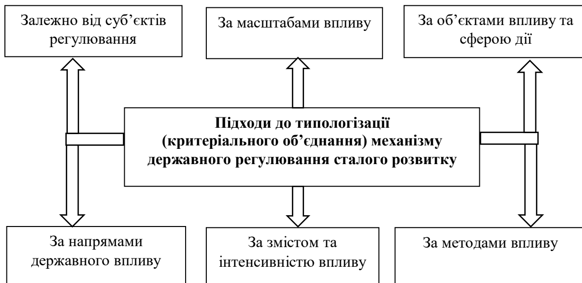
Рис 1. Підходи до типологізації механізму державного регулювання сталого розвитку

До виокремлення основних видів механізмів державного регулювання, що запропоновані дослідниками, слід підійти більш детально. Так, результати дослідження підходів науковців до типологізації (класифікації) механізмів державного регулювання сталого розвитку, зокрема Н. Р. Нижник, В. Б. Авер'янова, І. А. Грицяка, С. Д. Дубенко [10] дозволяють судити про те, що механізм регулювання є сукупністю заходів і спеціальних інститутів, за допомогою яких держава здійснює свій вплив [25, с. 14]. Узагальнюючи різні підходи науковців до класифікації механізму державного регулювання у контексті досягнення цілей сталого розвитку, виокремлені окремі підходи до типологізації (критеріального об'єднання) механізму державного регулювання сталого розвитку, що наведені на рис. 1.